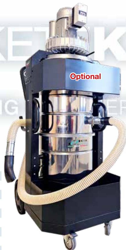
KV120V2MS KV120V3TS KV120V4TS KV120V2MK KV120V3TK KV120V4TK