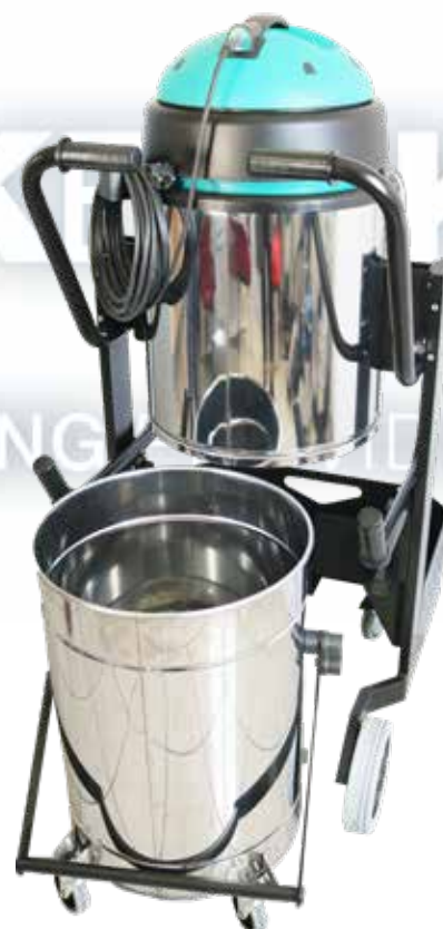
KV702VN KV702VS KV702VK